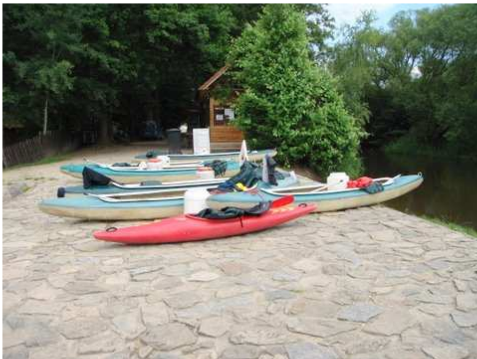
Lodě jsme vytáhli a čekali na jejich předání a odvoz