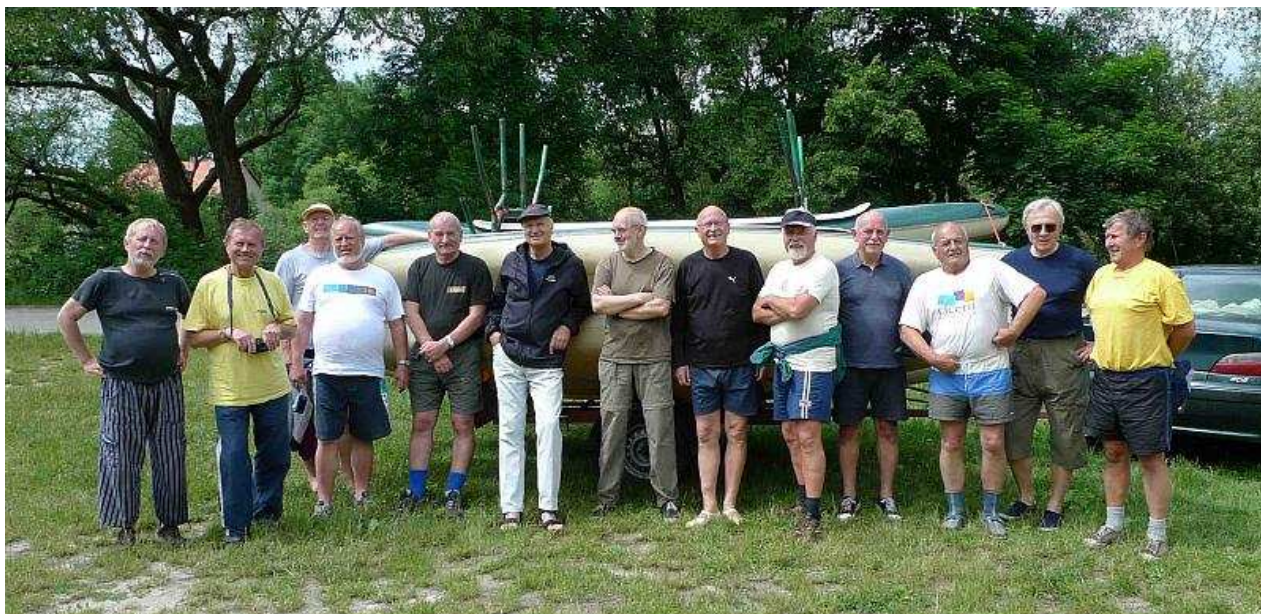
Druhý den to začalo na břehu u Jemčiny. Zde jsou už jen ti co ne jen žerou, ale i pádlujou.