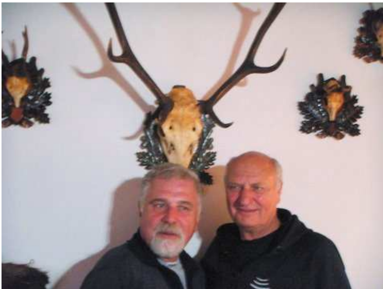
Stěna hostince byla využita k demonstraci přísloví, že „Čím kdo zachází, tím také schází“.