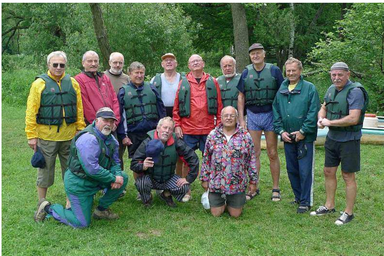
A za chvíli začalo jít do tuhého.