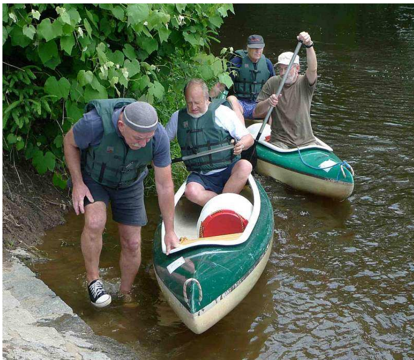
Abychom byli spravdiví, tak ne všichni dosáhli úrovně Pulce.