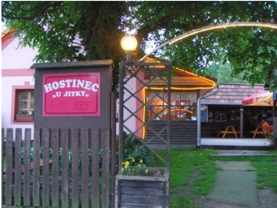
Hostinec U Jitky, kde nás očekávala kýžená pečená kachna, kvůli které jsme se uvolili jet na vodu.