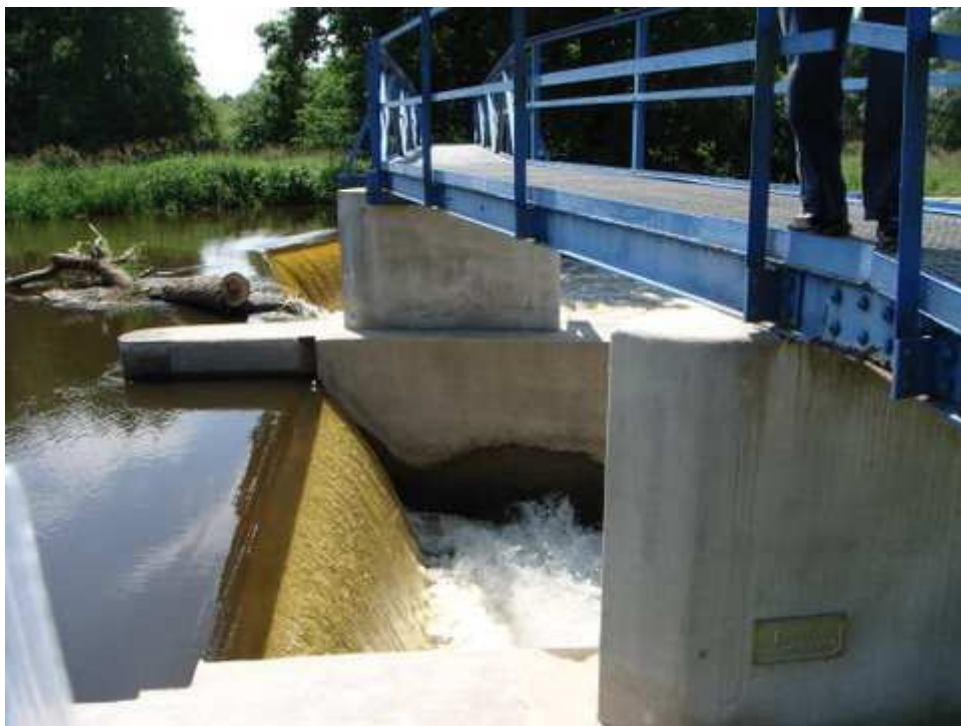
Nakonec jsme šťastně skončili na Hamru....