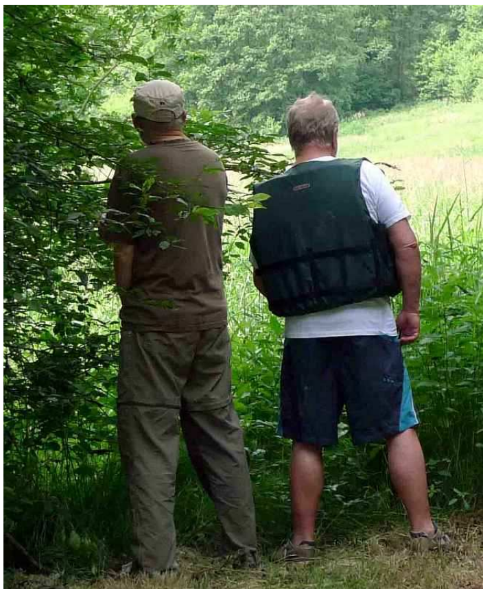
Po řádné přípravě....