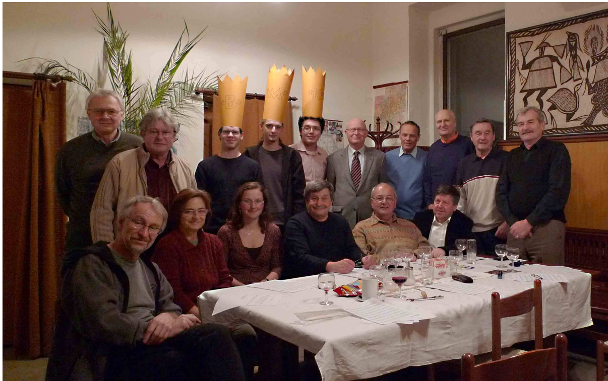
Společná Tříkrálová fotka Prvostředečníků a kapitanátu