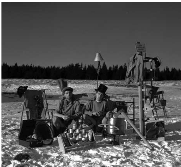
Loutky (Loulín, Plavec)