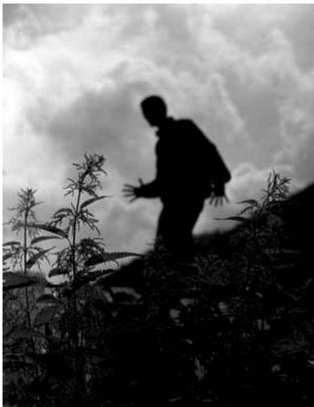
Fatra: Cancítko jen tak jde