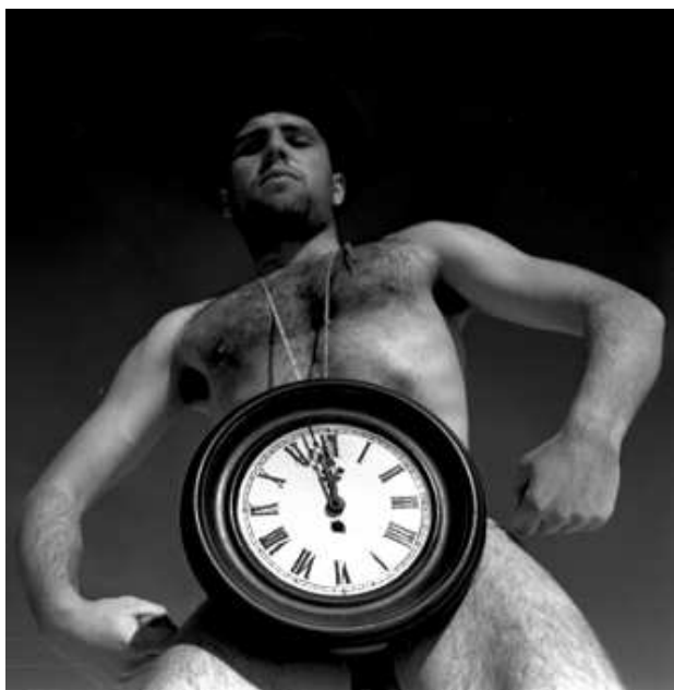
fotografie je nazvána „Bizon“