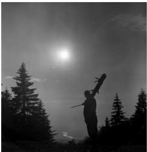
Fatra: Kotě nese kládu