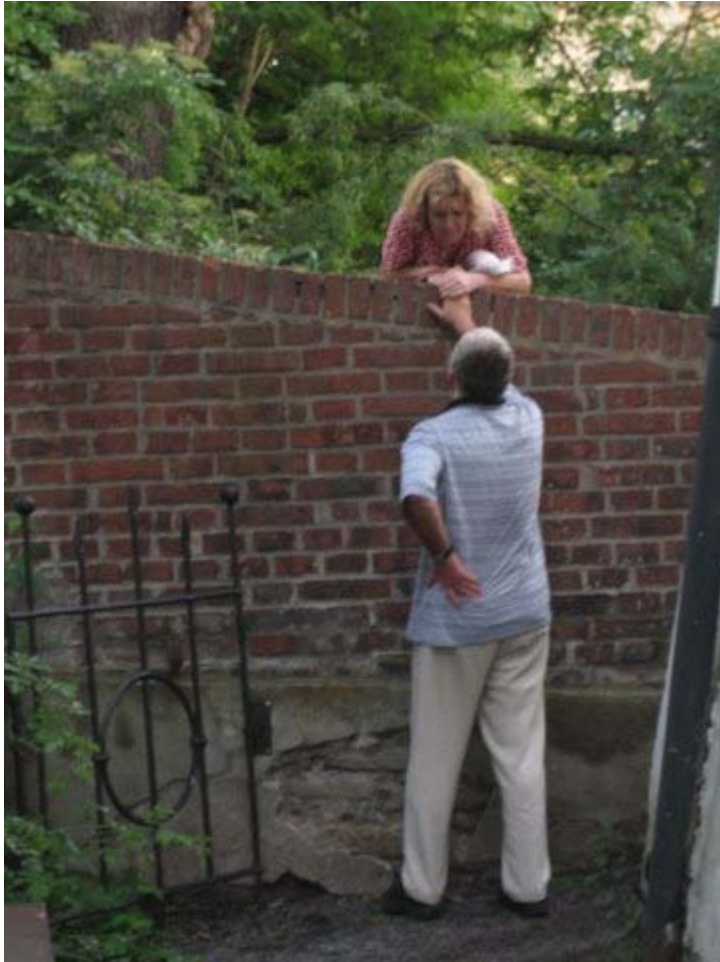
Loufín byl vyrušen a musel se věnovat Šílené Tetě, která si ho našla