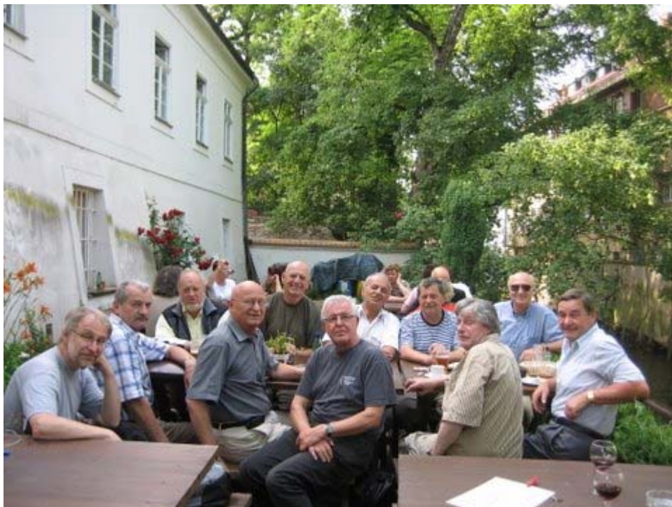
Začátek schůzky na břehu Čertovky 6.6.2007