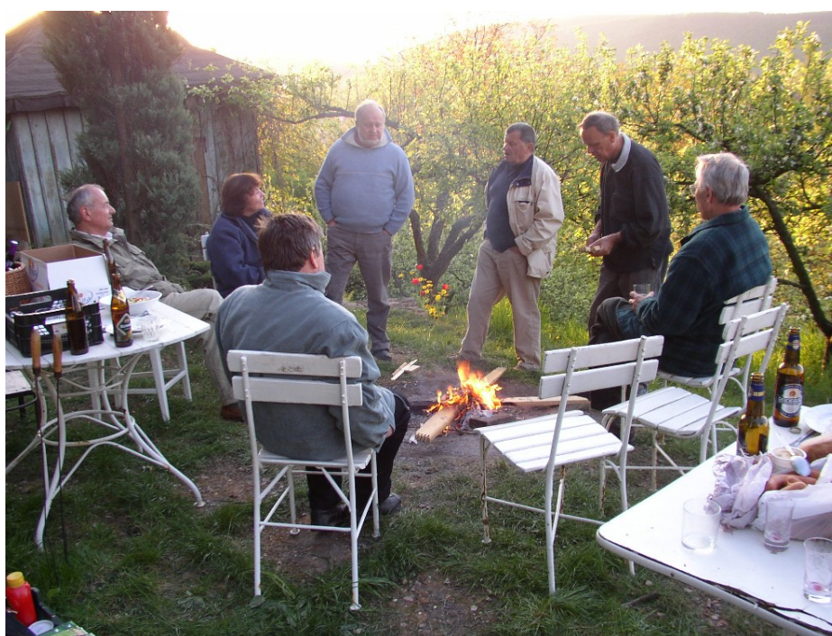
A později večer nám už byla zima.