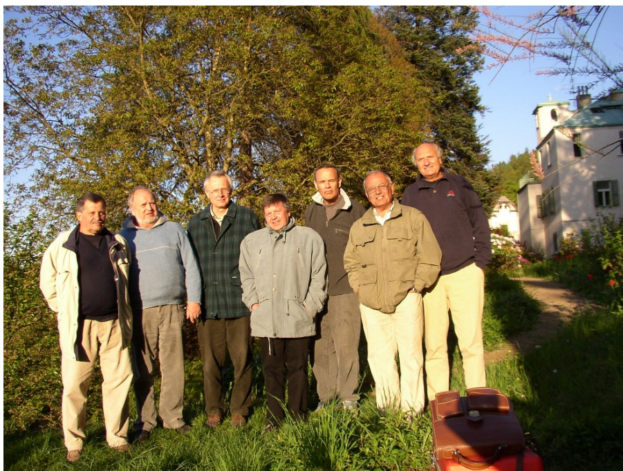
Ti, kdo přišli brzy