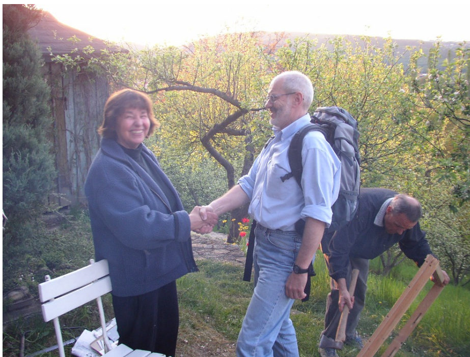
Zdraví se později příchozí