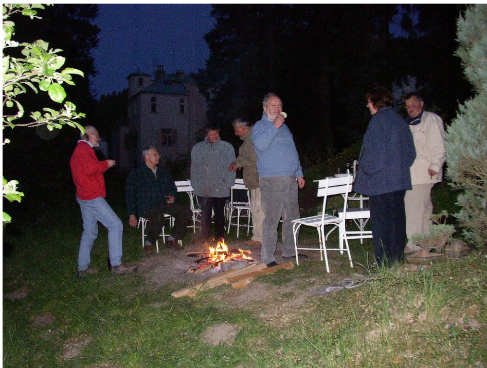
Klábosení o všem možném