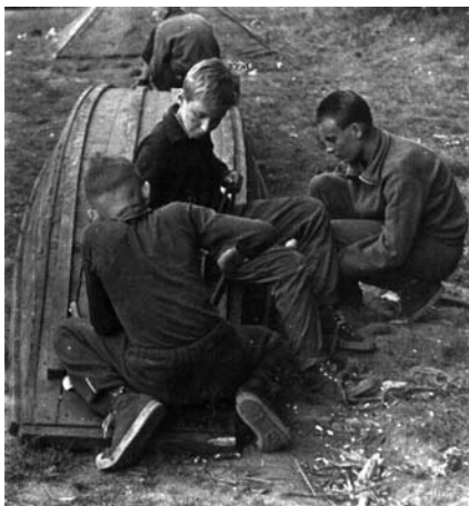
Temování pramice na Lužnici 1958