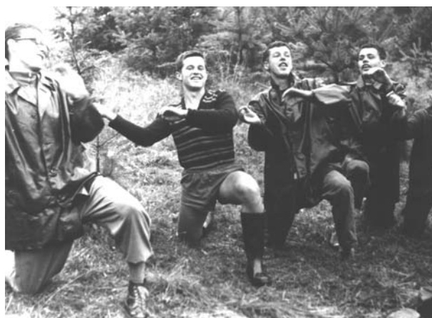
Nácvik na kankán, Lipno 1959